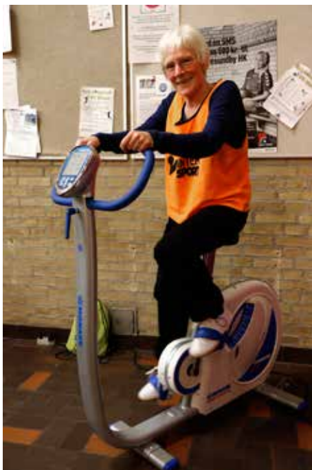
Test din kondi i 2017