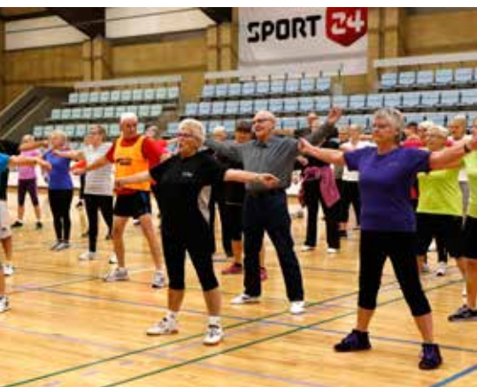
lar til Foråret 2017