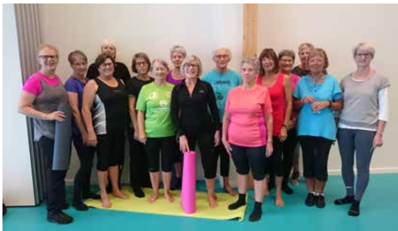
Ryg TRIM Vodskov