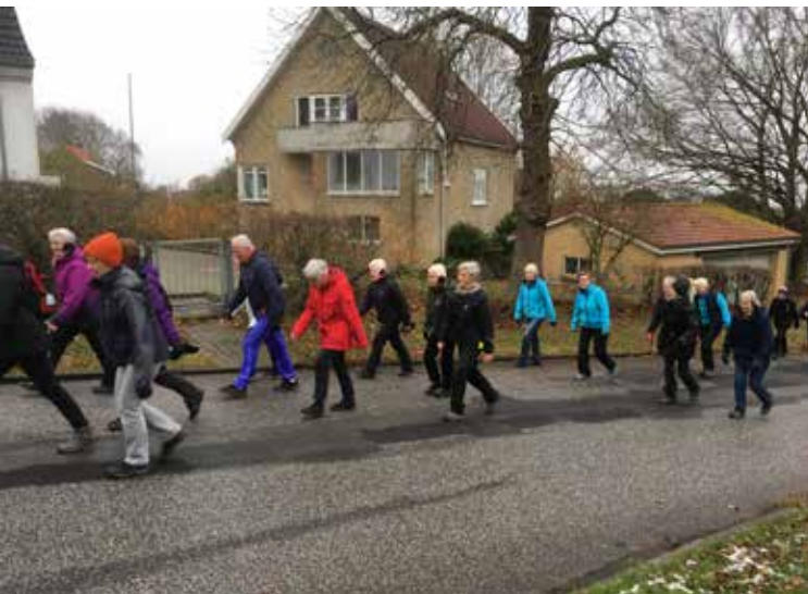
Op ad bakke. Traveholdet på vej op til Mølleparken