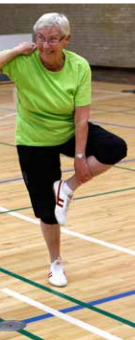
ng med et smil