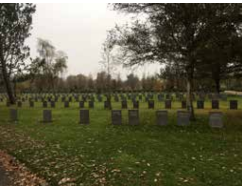
Udsnit af Søndre Kirkegård