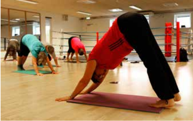
Der bygges bro i Aalborg SeniorSport