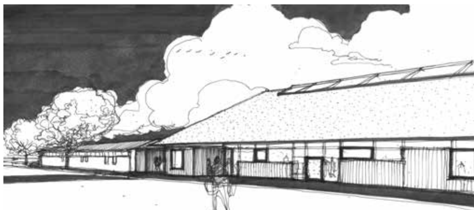
Skitse Set fra Provstejorden

Det forventes, at projektet kommer med i det kommende års budgetforhandlinger i Aalborg Kommune.