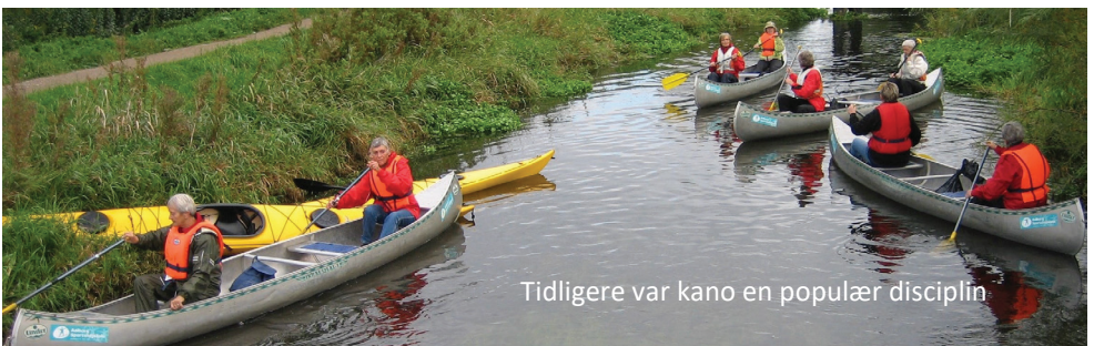
Tidligere var kano en populær disciplin