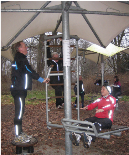
Outdoor fitness var også et tilbud i 2015