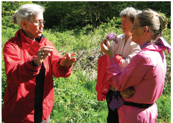
Smukke blomster og damer