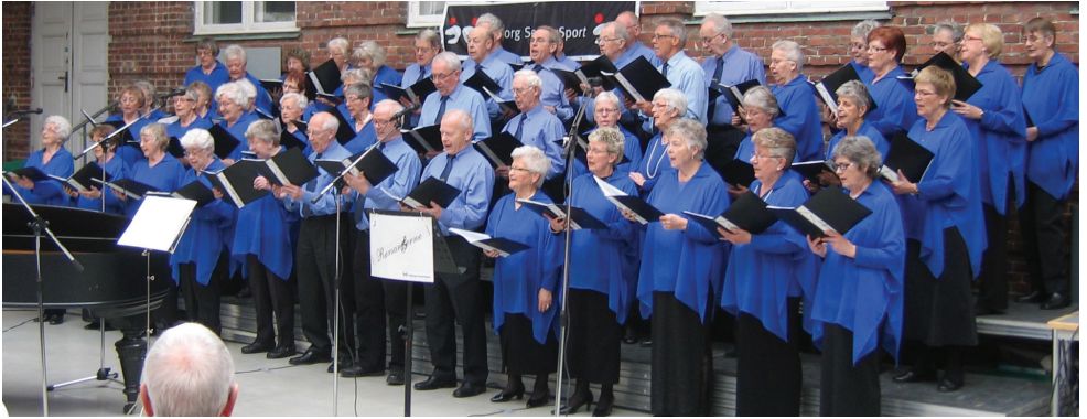
Sådan husker vi Rørsangerne i 2008